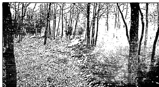
Brûlage dirigé "à la recule" sous taillis de Chêne blanc Controlled backward burning in white oak coppice (Rians, Var)