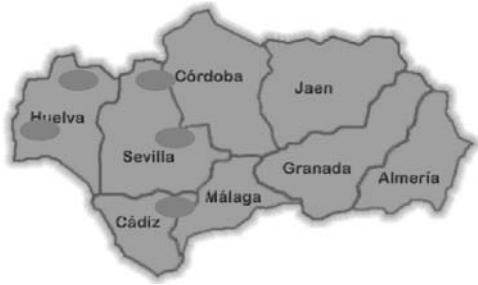
Fig. 1. Localisation géographique des cinq zones d'étude.